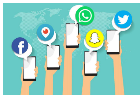
Fig. 2: (El mapa del uso de las redes sociales, Fecha publicación diciembre 23, 2016, Categoría Analytics,Móvil,Publicidad Online,Redes Sociales)

En este apartado se trataran a las redes sociales como medios para encontrar al amor verdadero y como estas plataformas han cambiado la manera de conectar con las personas y ahora vivir en la era digital