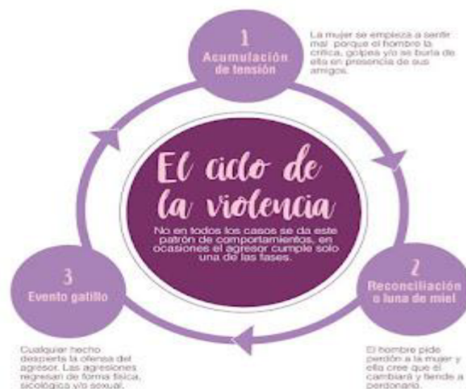
Fig. 3: